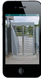
OpenStage Gate View V2 auf dem iPhone

Auch für Mitarbeiter, die öfter unterwegs sind, stellt OpenStage Gate View V2 eine Lösung bereit und bringt Echtzeit-Videobilder auf dem iPhone – sehr benutzerfreundlich dank einer Applikation, die einfach und in gewohnter Weise aus dem Apple App Store heruntergeladen werden kann.