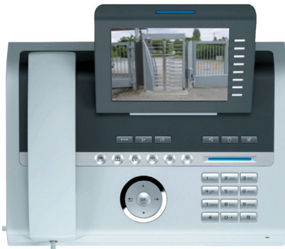
OpenStage Gate View V2 auf dem OpenStage 60 Telefon

In Verbindung mit einer Türsprechanlage können Sie sogar eine Sprechverbindung aufbauen und durch einen einfachen Tastendruck am OpenStage Telefon der Person aus dem überwachten Bereich die Tür öffnen.